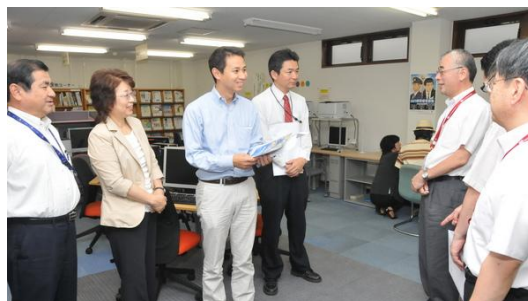
【山口県内の雇用状況について話を聞く】