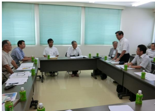
【県本部での研修会、活発な意見交換】