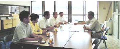
【仮設の港湾事務所で説明を受ける県議団】

県議会土木建築委員会の県内視察が行われ、地元議員として同行視察しました。国道490号線交通安全施設整備事業と東見初地区港湾整備事業について、それぞれ説明を受けました