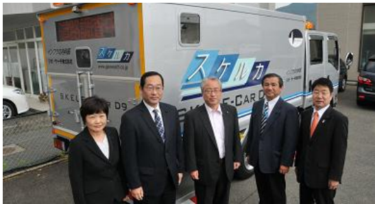
公明党県議団、空洞探査車の前で、 (県本部前)