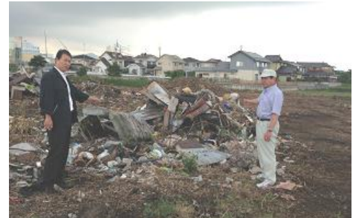
産廃対策について現場確認 （宇部市妻崎開作）