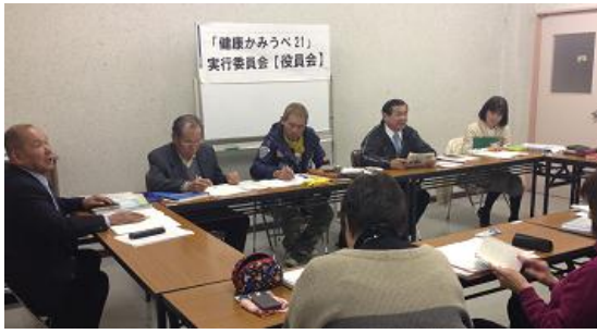
6回目の「健康かみうべ21」役員会 （上宇部ふれあいセンター）