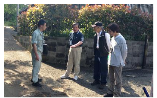
道路の陥没改修について相談受理 （宇部市山門）