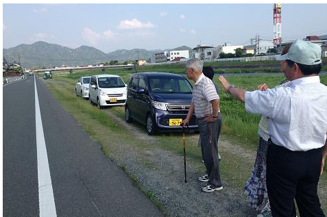
渋滞解消について相談受理 （山口市）