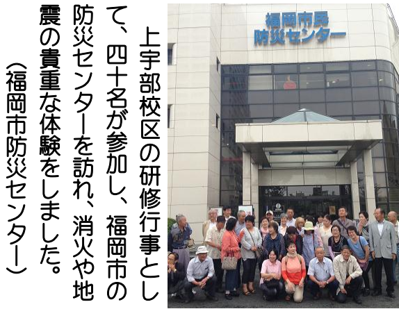
上宇部校区の研修行事として、四十名が参加し、福岡市の防災センターを訪れ、消火や地震の貴重な体験をしました。 （福岡市防災センター）