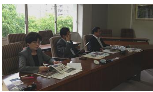
公明市議団と行政視察・教育、福祉行政を 学びました。(島根県松江市)