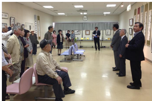
書道展にて激励の挨拶 (阿知須サンパーク)