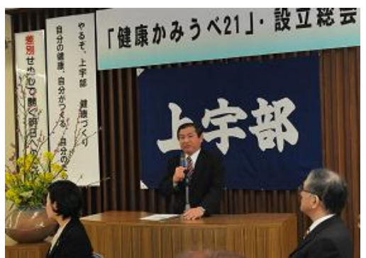
「健康かみうべ21」設立総会で挨拶