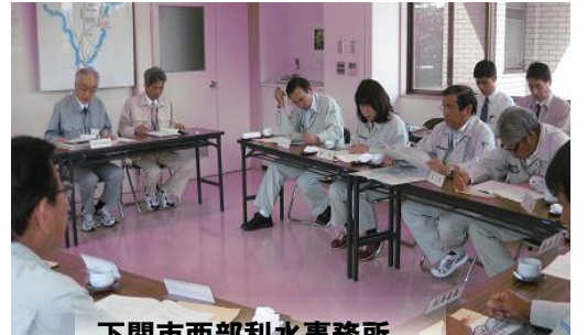
下関市西部利水事務所