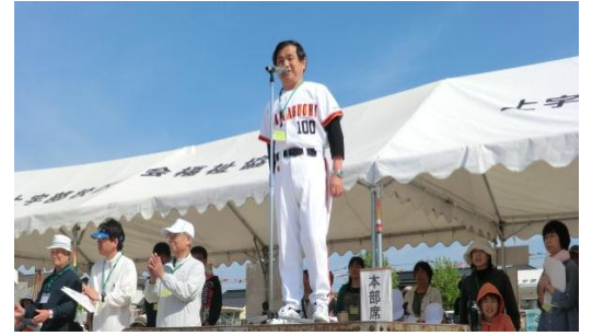
校区スポーツ大会にて開会あいさつ （上宇部小学校）