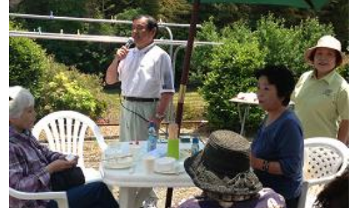
地元の高齢者施設の夏祭り において挨拶（宇部市山門）