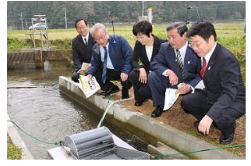
県議団で小水力発電を視察 (萩市阿武町)