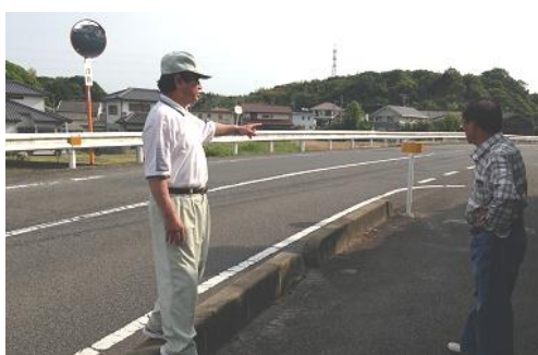
交通規制について相談受理 （宇部市際波）