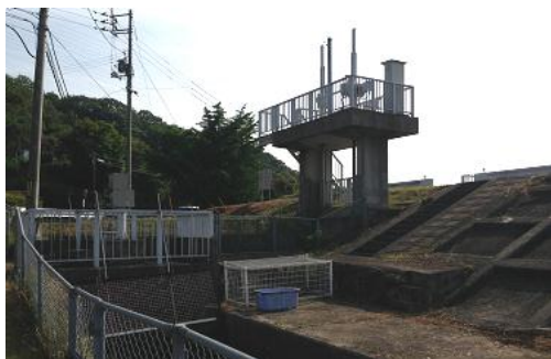
雨水ポンプの改修完了 （宇部市浜田町）