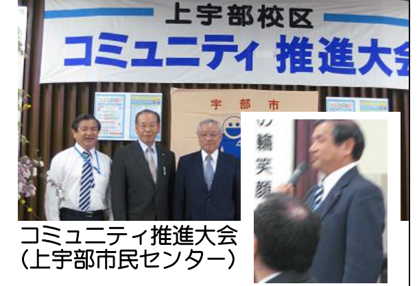
コミュニティ推進大会 （上宇部市民センター）