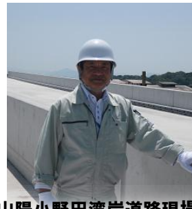
山陽小野田湾岸道路現場