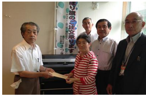
ボランティア麦の会の皆さん 障がい者就労施設にコピー機を寄付 （美祢市）