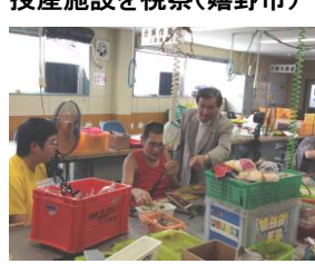
授産施設を視察(嬉野市)