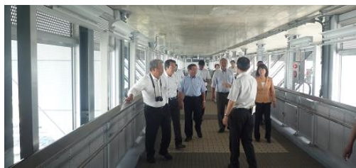
新湊大橋の橋脚部の歩道橋を視察(湊市)