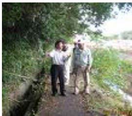
竹林伐採の現場視察(中山)