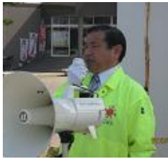
街頭遊説で政策を訴える