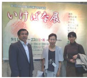
活け花展で作品を鑑賞 (下関市)