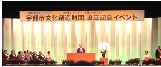
宇部市文化創造財団の設立記念式典に参加(宇部市記念会館)