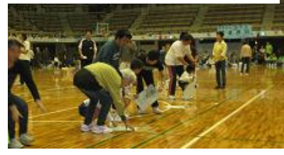
遊遊運動会(俵田体育館)