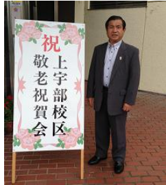
敬老会に参加し激励 (JA山口宇部)