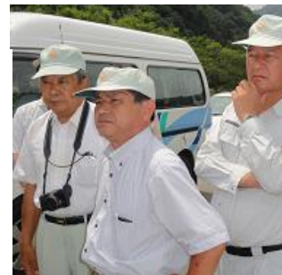
災害現場(山口市徳左・萩市下小川)