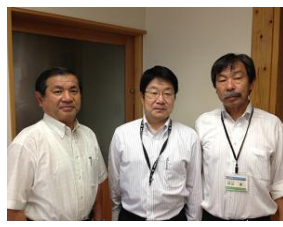
うれしの支援学校の校長 先生と曾田県議(嬉野市)