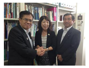
樹屋議員と早川准教授(理科大学)