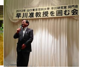
東京理科大准教授を囲む会 で挨拶(名古屋市)