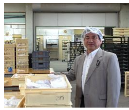
アメリカパンの工場・ 授産施設を視察(嬉野市)