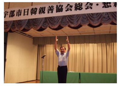
宇部市日韓親善協会総会で 万歳三唱(河長)