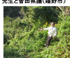
事故現場へ直行(小野田市)