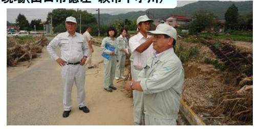
JR山口線の復旧状況を視察