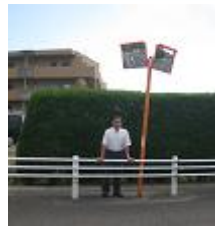
カーブミラの設置