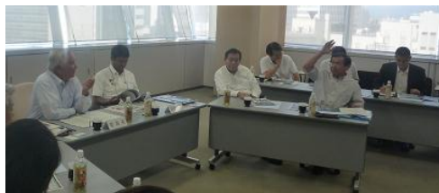
コンパクトシティ計画を研修(富山市)