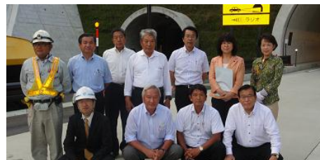
国道 41 号高山バイパス工事を視察(高山市)